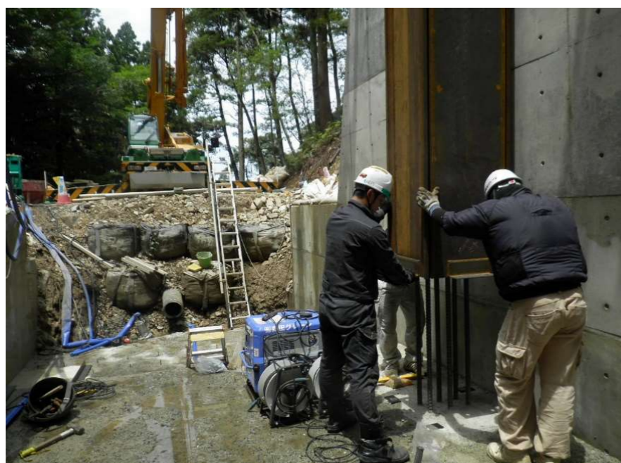
ダム中央部に鋼製スリットの柱を組立中です。

*お気づきの点がございましたら、現場事務所(児童公園内)の川上まで遠慮なくお伝え下さい。