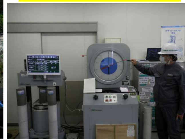
コンクリートの品質試験をしているところです。