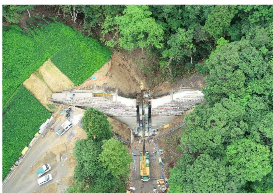
ドローンでの空撮です(6月29日PM現在)。