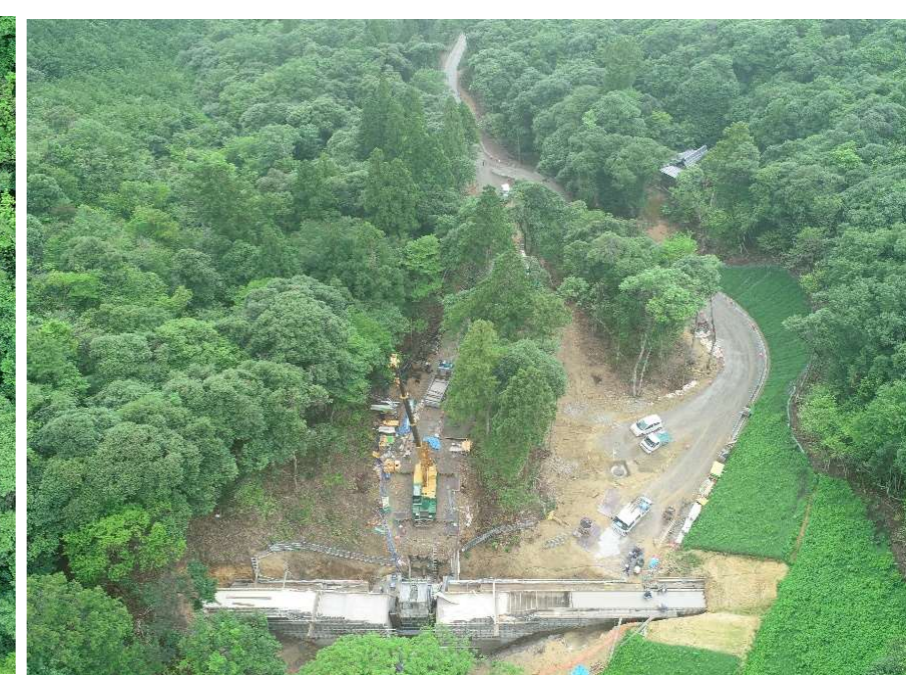
ドローンでの空撮です(6月29日PM現在)。