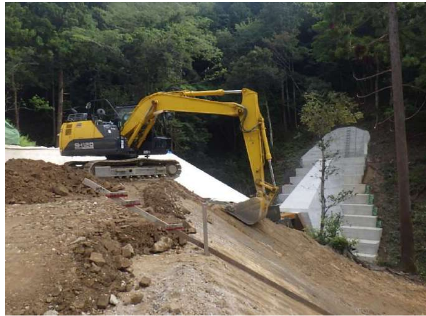
管理用道路の仕上げ作業をしています。