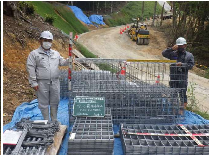
崩落した部分の補修用資材の確認をしています。