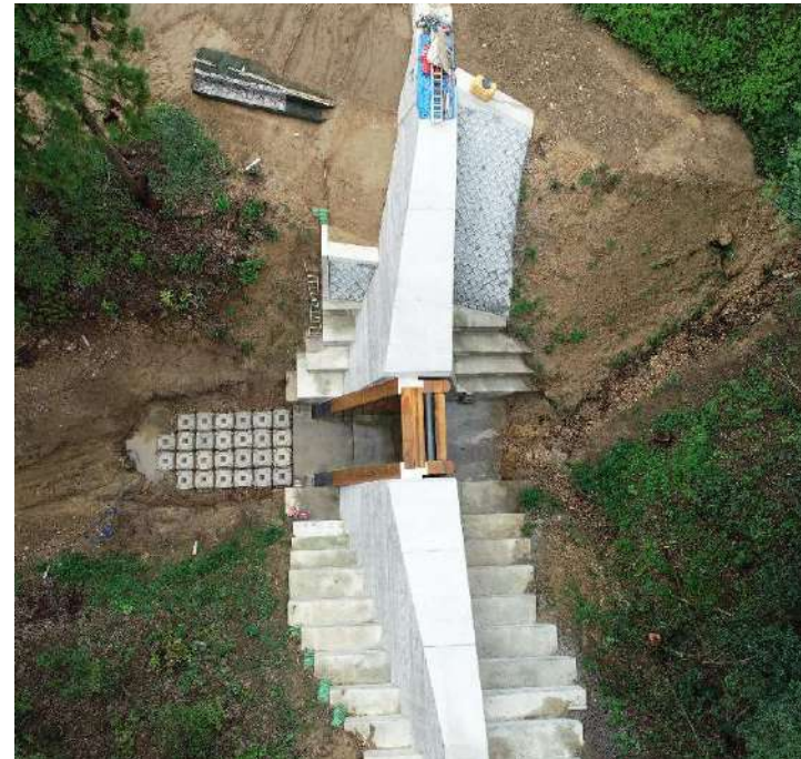
ドローンでの空撮です(9月2日PM現在)。