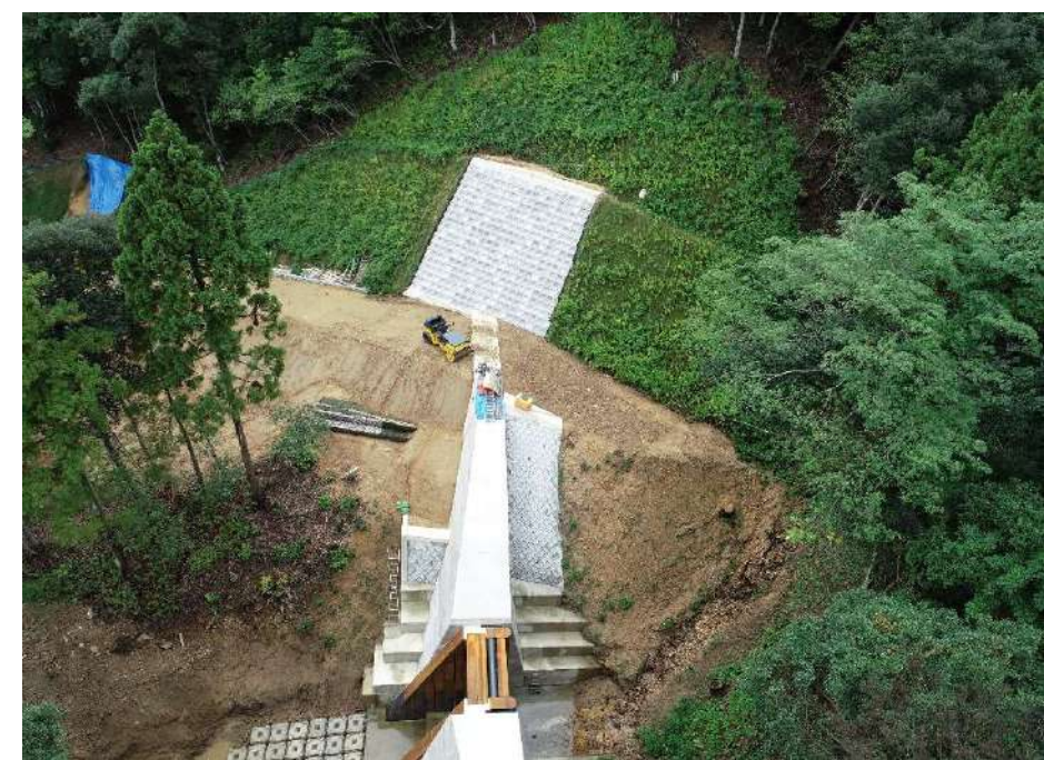
ドローンでの空撮です(9月2日PM現在)。