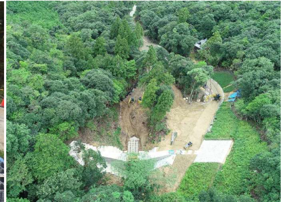
ドローンでの空撮です(9月2日PM現在)。