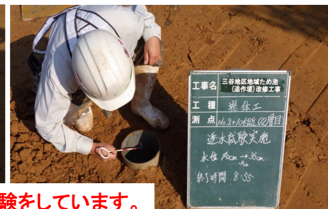
盛立後の試験をしています。