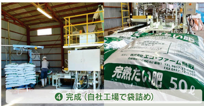
④ 完成 (自社工場で袋詰め)